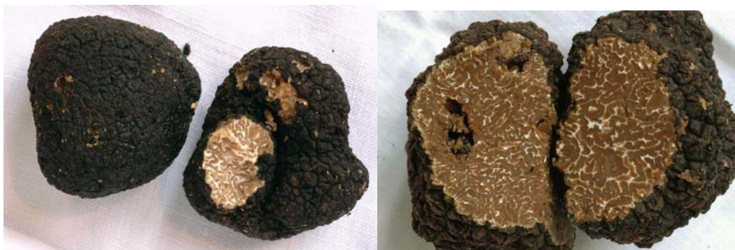
Tuber uncinatum Chatin (Photos Etienne Charles, 26/11/2005)

Voici maintenant quelques informations pratiques :