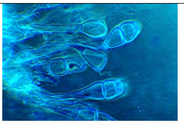
Téleutospores de la f. fragilipes , à apex décentré