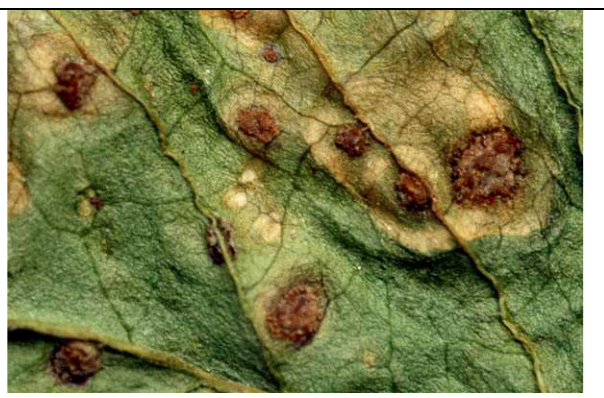
Détail des sores du stade III

Les sores pustuleux, fermes, de couleur roux +/- violacé, sont de 2 sortes :