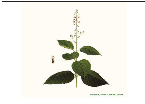
Plante avec inflorescence