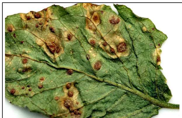
Sores du stade III, gros et pustuleux