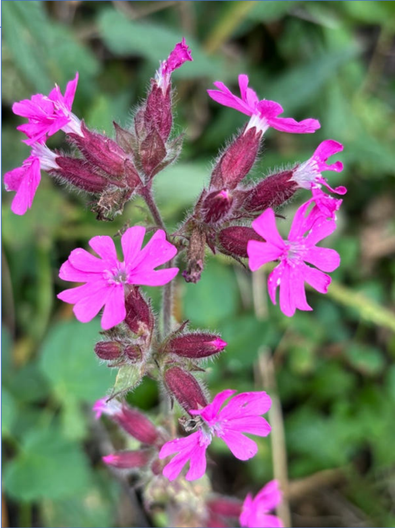
Stade II de Puccinia behenis sur Silene dioica - 06/05/2026 – Belgium – Brabant Fiche conçue et réalisée par Daniel Deschuyteneer