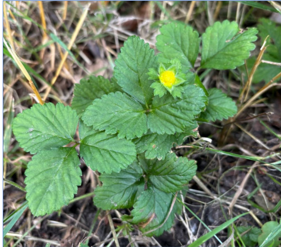
Fleur jaune (pas blanche)