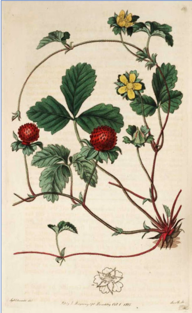
Fragaria indica Andrews