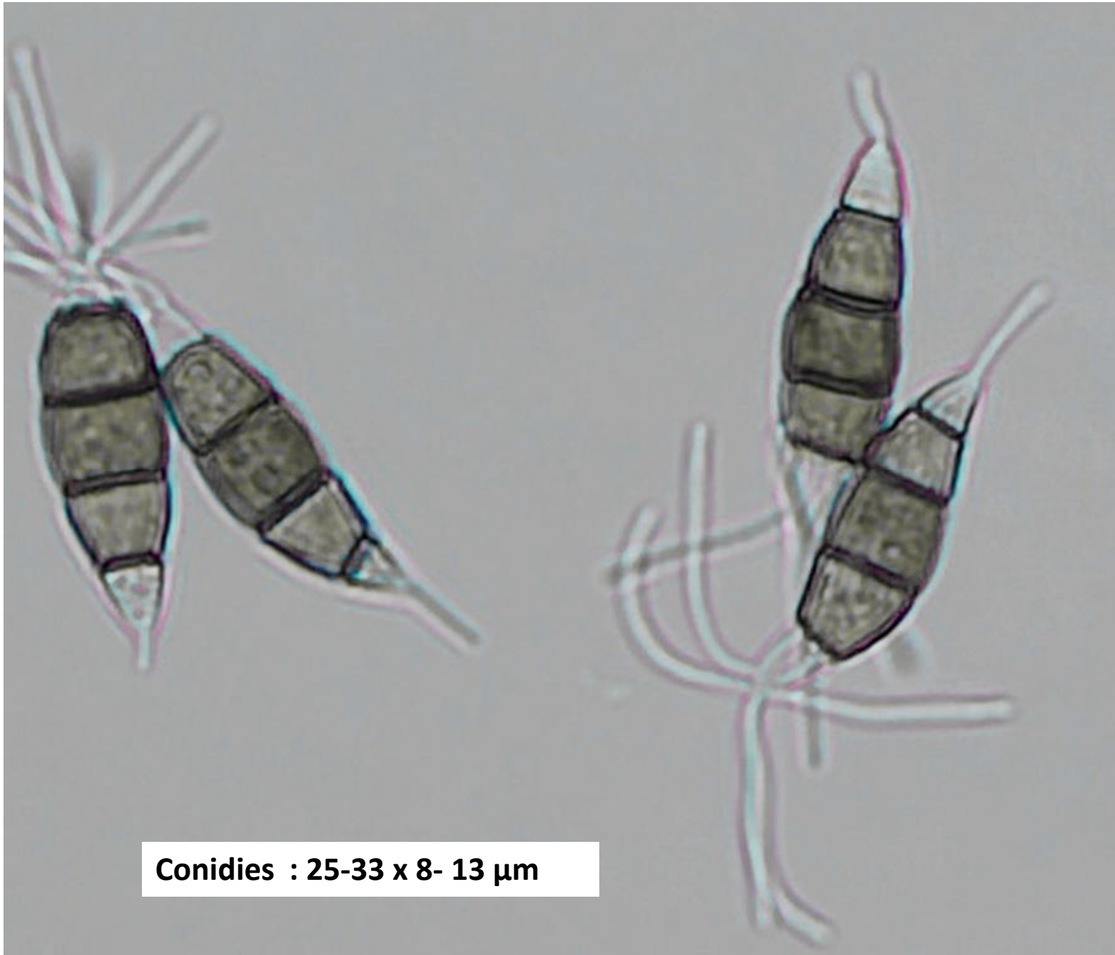
Conidies : 25-33 x 8- 13 \mu m