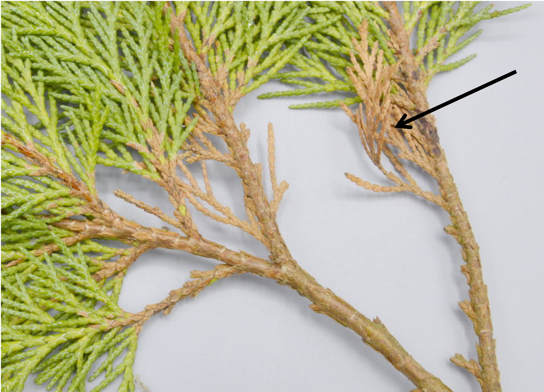
Le champignon se développe sur les parties roussies