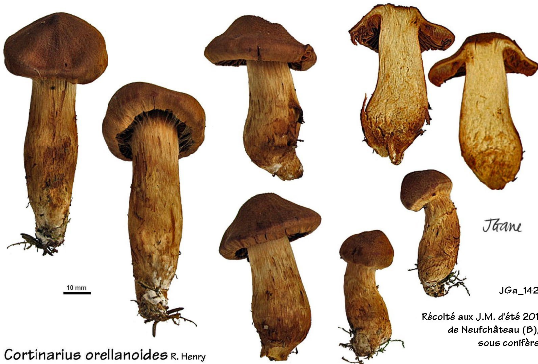
Cortinarius orellanoides R. Henry