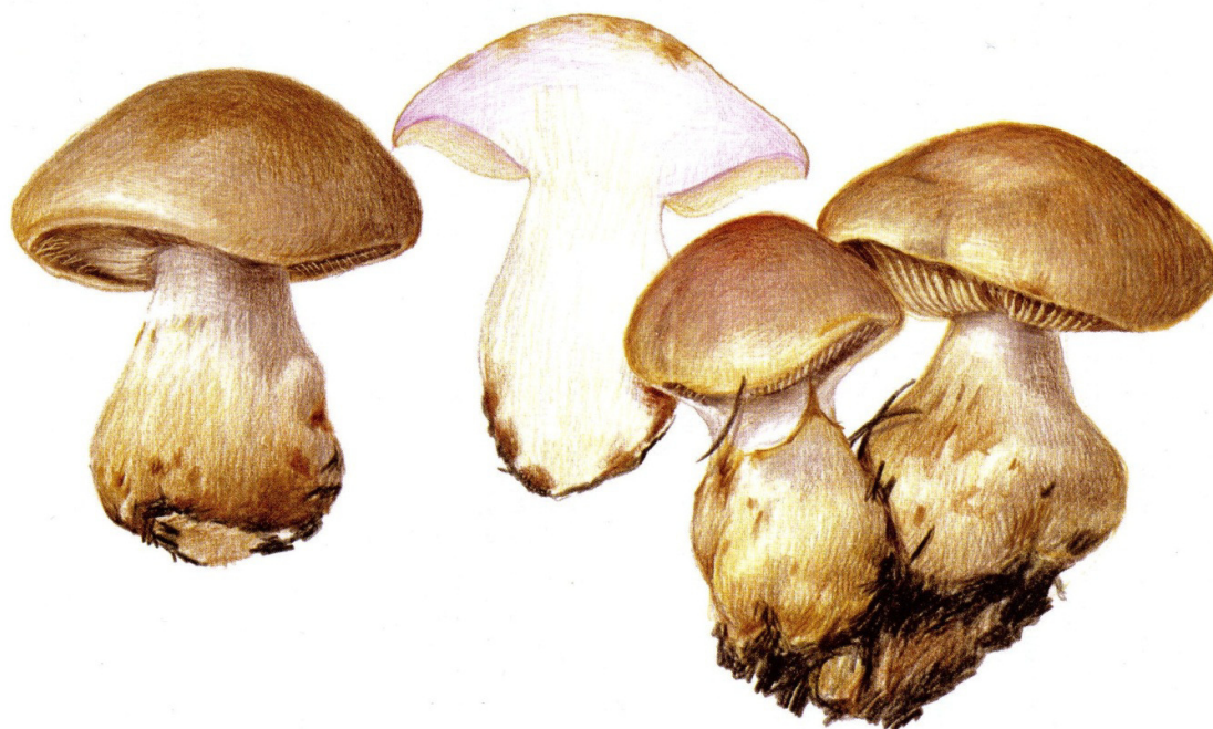
Planche de Moëgne-Locoz, édité dans le bulletin de la FMBDS n° 204-205 p. 58

B1 Chair blanche, inodore. Cespiteux, sous épicéas montagnards et subalpins, spores (8) 8,5-10,5 (11) x 6-6,5 µm ..... C. pseudonebularis Moëgne-L. sp. nov. (Pl.206, f.350)