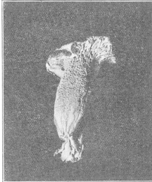
FIG. 3. — Clitopilus prunulus , forme à hyménium partiellement poré (on remarquera que, vers la marge, l'hyménium a un peu conservé la formule lamellée). M lle Reverdy leg., 9 septembre 1934 ; gr. nat.

La masse de crottin ayant été cassée et comprimée lors de son transport au laboratoire, il se pourrait que des sujets tout au début de leur développement aient été lésés de ce fait et que