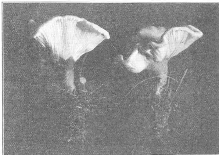
FIG. 1. — Clitocybe infundibuliformis , forme cantharelloïde. Le Pré-Vieux (Rhône), octobre 1935 ; gr. nat.

Nous souvenant que C. infundibuliformis est une des sept ou huit espèces qui dégagent de l'acide cyanhydrique, nous avons recherché par le procédé classique de Guignard (papier picro-