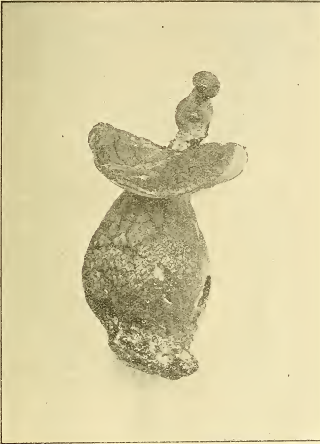
FIG. 1. — Boletus edulis .

nous a pas été possible de vérifier les observations de M. GUÉGUEN. Nous publions ces deux photographies comme