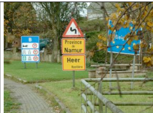
Juste à la frontière franco-belge ... Just at the border between France and Belgium

Cette session se déroule au Domaine de MASSEMBRE , à Heer-Agimont (5543), juste à côté de GIVET. Le domaine s'étend au sommet d'un plateau boisé. La restauration (banquet y compris), les salles de travail et de conférences se situent dans l'enceinte du centre (unité totale de lieu).