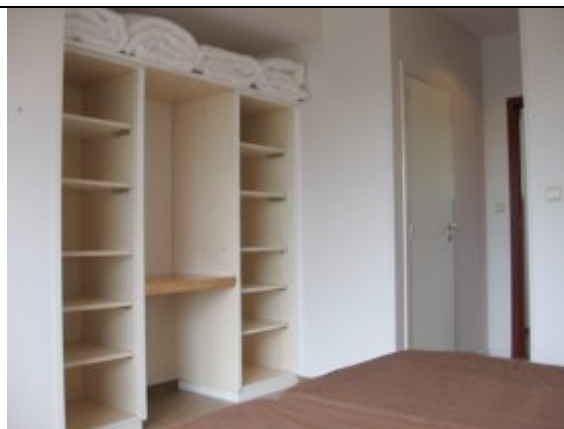
une chambre, rénovée en 2007

Massembre est situé à 2,5 km du centre de Heer, dans la commune d' Hastière , la "Perle Verte" de la Haute-Meuse ; le village se trouve à 20 km de Dinant et de Beauraing, et à 4 km de la petite cité française de Givet. Le "Massembre", petit ruisseau qui délimite à la fois le domaine et la frontière française, a été choisi pour donner son nom au domaine. Le parc comprend 140 ha de feuillus : un énorme espace naturel dans un silence envoûtant. En plus de ces deux qualités (nature et quiétude), vous serez séduit par le logement : il est très confortable et de bonne qualité, et se pratique toujours en pension complète. L'équipe de cuisine veille à vous préparer des repas savoureux, et un banquet sera prévu le jeudi soir.