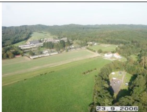
vue aérienne du domaine