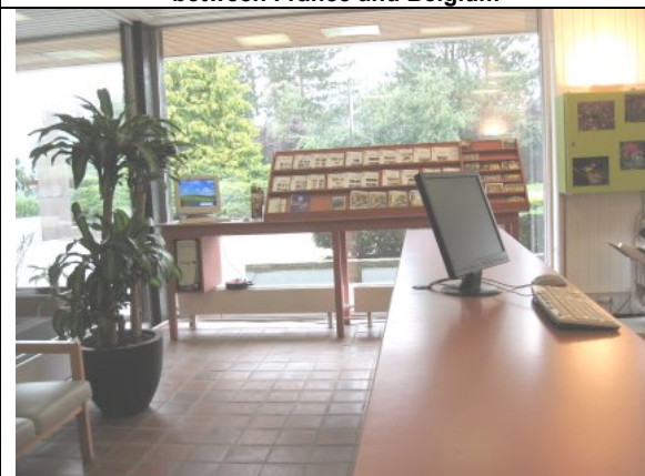
la réception, rénovée en 2007