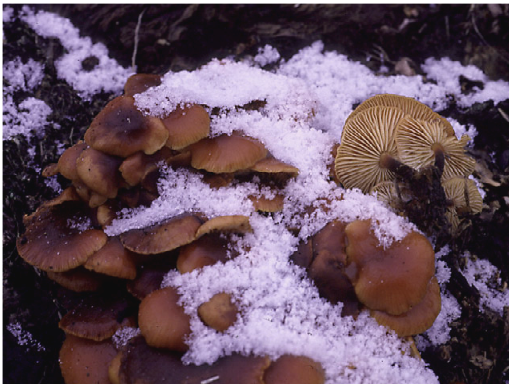
Flammulina velutipes (Curtis : Fr.) P. Karst. en hiver

Avec cette image apaisante, nous vous souhaitons un joyeux Noël et vous présentons nos meilleurs vœux de bonheur pour 2016.