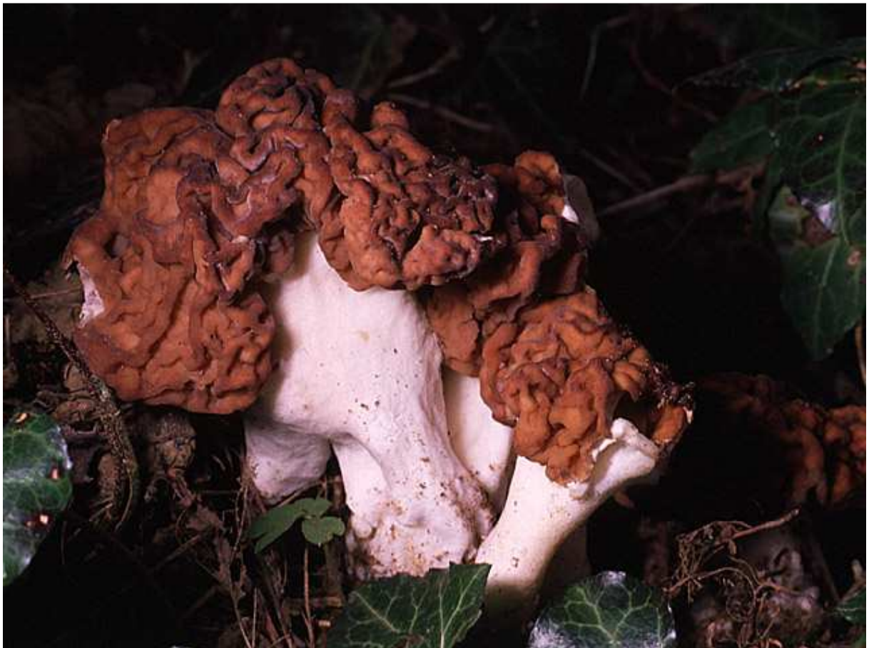
Spugnola bastarda Gyromitra esculenta (Pers. :Fr.) Fr.

La mycologie et la mycotoxicologie sont des sciences qui impliquent discipline, rigueur, cohérence et sérieux. »