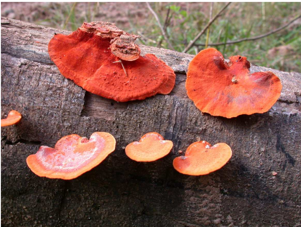
Pycnoporus sanguineus (L.) Murrill