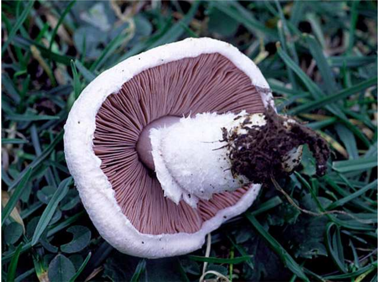
La garrigue des champs !

nationale qui considère notre Président comme un dangereux inconscient, parce qu'il explique en public que, pour déterminer un champignon, il faut aussi le goûter. Bien sûr, il est plus prudent de sortir son Phillips et de feuilleter les images.