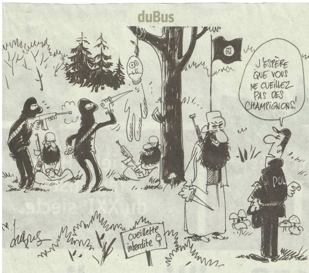
Dessin de Dubus dans La Libre Belgique du 22.10.15